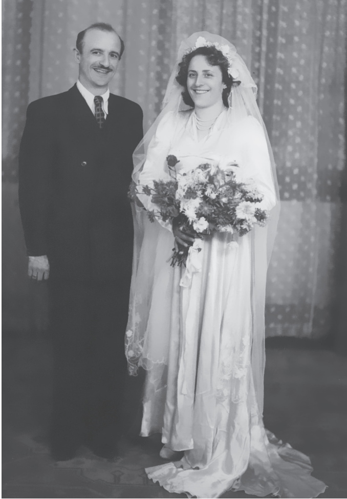
Me gruan, Anën, ditën e martesës