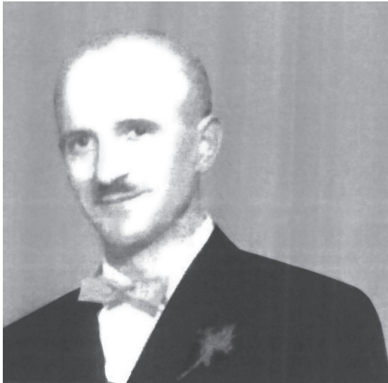
Një foto e vonë, pak para vdekjes